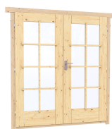
1.62×1.885 м.1 шт.

7. Platbands: trocken gehobelte Platte 20 × 100 mm;