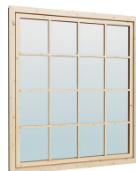
Fenster 1.62×1.885 м.1 шт.