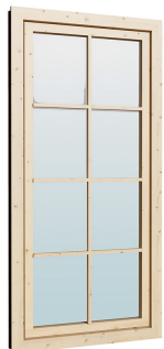
Fenster 0.84×1.885 м.2 шт.