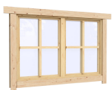
1.34×0.91 м.1 шт.