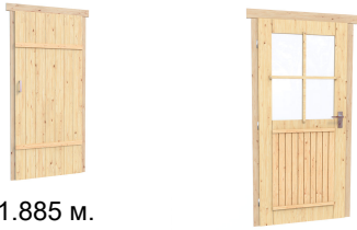
0.84×1.885 м. bath.2 шт.