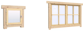
0.40×0.38 м.2 шт. 1.34×0.91 м.1 шт.