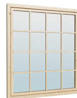
1.62×1.885 м.1 шт.