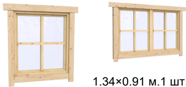
1.34×0.91 м.1 шт.