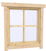
0.87×0.78 м.1 шт.