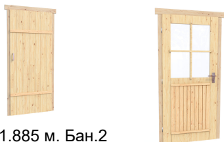
0.84×1.885 м. Бан.2 шт.