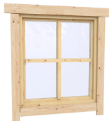
0.87×0.78 м.1 шт.